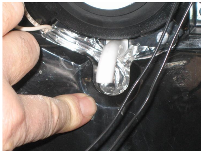
Tape elementet inn i fordypning i bakvegg